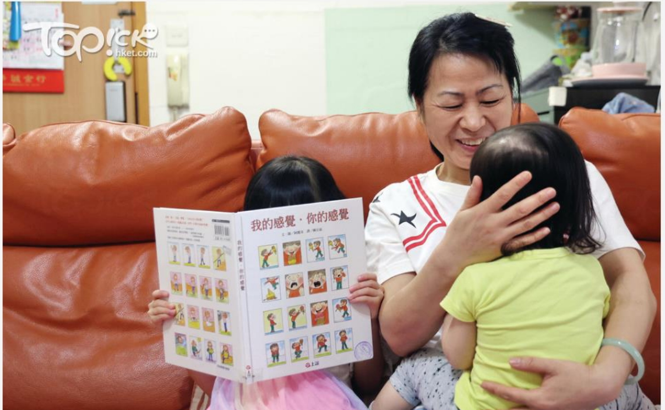
▲ 寄養兒童狀況不一，陳太用心照顧，視他們如子女愛錫。

陳太決定當「緊急寄養服務家庭」，曾照顧小朋友由42天至2年不等。在9年多之中，總共照顧了24位小朋友，主要是女孩，由嬰幼兒至最大9歲。